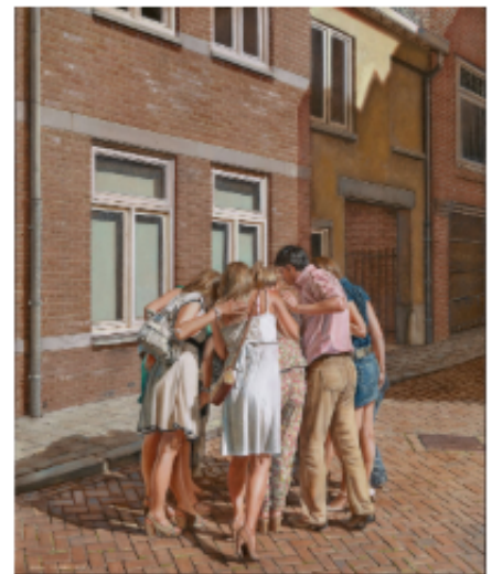
Evert Thielen, Gebeurtenis (2016)